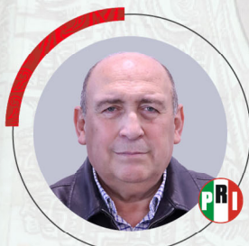
Dip. Rubén Ignacio Moreira Valdez Coahuila 2a.