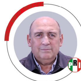
Dip. Rubén Ignacio Moreira Valdez Coahuila 2a.