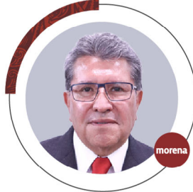
Dip. Ricardo Monreal Ávila Zacatecas 2a.