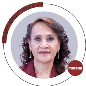
Dip. María de los Dolores Padierna Luna Ciudad de México 04.