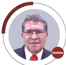
Dip. Ricardo Monreal Ávila Zacatecas 2a.